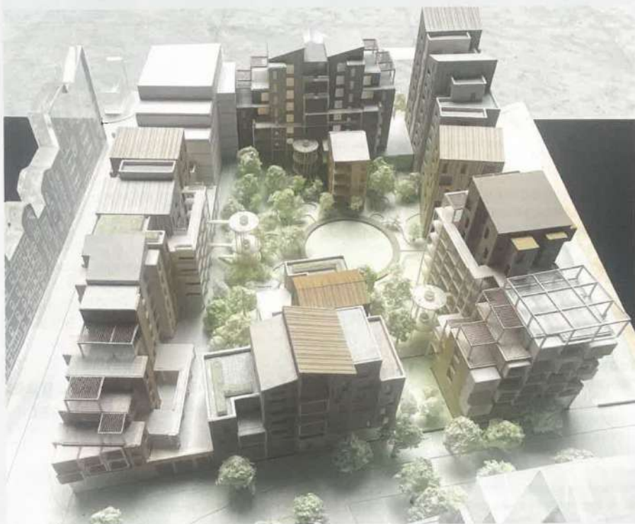
Projet « Respiré », Zac République à Montpellier. © Architecturestudio

Bacotec et le groupe Spag, co-promoteurs sur le lot F2 la Zac République, à Montpellier, ont combiné logements spacieux et évolutifs adaptés au climat méditerranéen et espaces de convivialité.