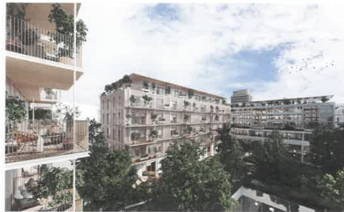
Le projet Woodeum à Cergy-Pontoise, sur le site de l'ancienne patinoire, « s'appuie sur l'existant pour remodeler avec intelligence et technicité un quartier central, en y insufflant une nouvelle vie autour d'un jardin arboré ».

Les premiers lauréats de la 3 e édition du concours Inventons la Métropole du Grand Paris ont été présentés le 15 mars, au Mipim à Cannes : Linkcity (site de Python-Duvernois, Paris 20 e ) ; Woodeum (site « Patinoire-Oréades », Cergy-Pontoise) ; Sefri-Cime (Emprise Leclerc, Villiers-sur-Marne) ; Lauranne Schied Real Estate (site « Goutte de Lait », Pantin) ; Galia (site « Météore », Pantin) ; Redman (site « Méhul », Pantin) ; IPE (Route de Roissy le Vieux Pays, Tremblay-en-France) ; Sogeprom (Général-de-Gaulle, Villeneuve-le-Roi).