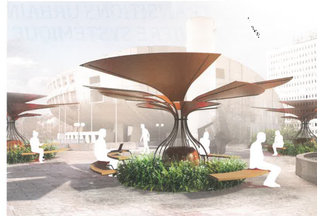
Perspective Oyas géant.

Le concept sera présenté au salon Materials & Light, les 11 et 12 septembre prochains, au Centquatre, à Paris.