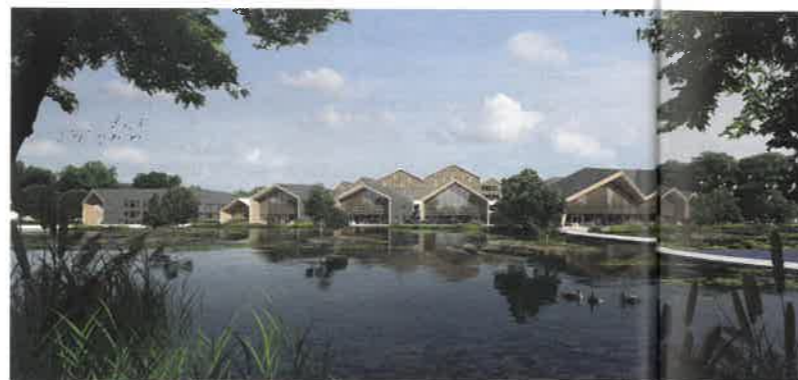
Deloitte University EMEA à Bailly-Romainvilliers-Val d'Europe. → Architecte : Dubuisson Architecture - Developpeur : Nexity. © Dubuisson Architecture

Quatre livraisons ont été prévues en 2023 au titre d'IMGP1 : la Noue Caillet à Bondy (mandataire groupe Pichet), le 29 rue du Soleil à Paris (mandataire Des clics et des calques), le terrain du Manoir à Vaucresson (mandataire ADIM) et les terrains Bizet à Villejuif (mandataire Pichet).